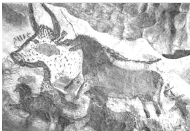
Detalhe de pintura rupestre na gruta de Altamira, Espanha.

9) Observe a imagem a seguir e responda à questão.