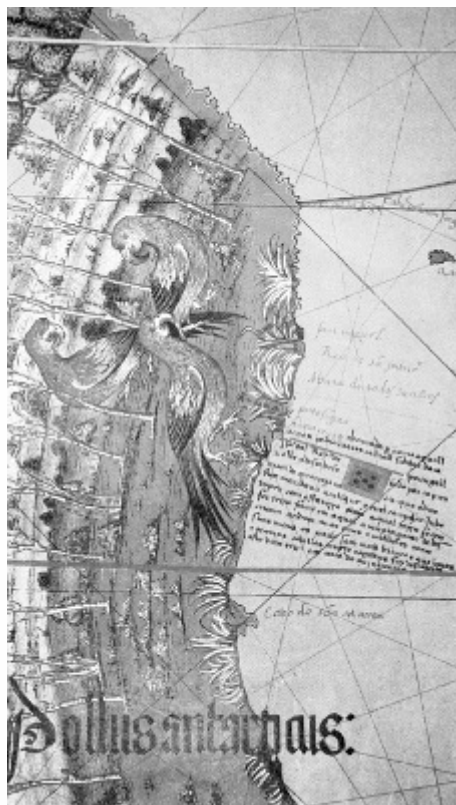
Planisfério de Cantino, 1502.