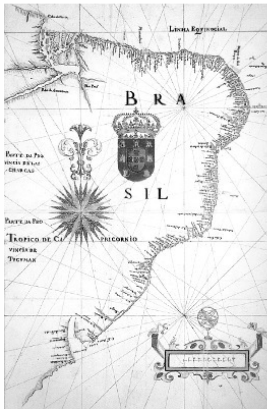
Mapa do Brasil, de João Teixeira Albernaz, 1666.

ADONIAS, I; FURRER, B. Mapa: imagens da formação territorial brasileira . Rio de Janeiro: Fundação Odebrecht, 1993.