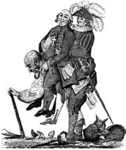
(As três ordens, 1789. http://online-lemen.levrai.de )

A charge ilustra as três ordens sociais existentes na França antes da Revolução de 1789. Identifique essas três ordens e justifique o posicionamento dos personagens na charge.