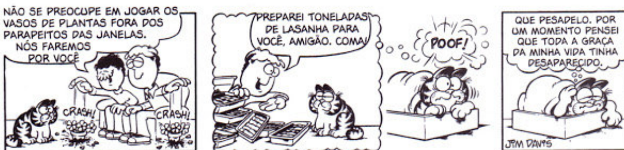
DAVIS, Jim. Garfield . Tradução da Agência Nacional Press. Porto Alegre: L&PM, 2009. p. 353.

a) Qual é a regência dos verbos "preocupar-se", "preparar" e "pensar" na tira?